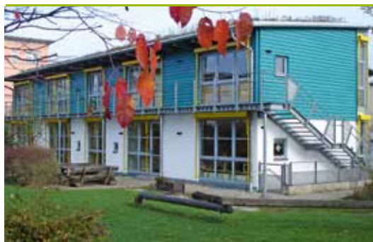
LBV-Kindergarten arche noah in Hilpoltstein

Wie die Verankerung im Leitbild einer Kindertageseinrichtung aussehen kann, zeigt die Konzeption des LBV Kindergartens arche noah in Hilpoltstein: Von Beginn an lag ein Schwerpunkt der Einrichtung in der ökologischen Orientierung. Über die Jahre hat sich dieser Schwerpunkt zur Bildung für nachhaltige Entwicklung weiterentwickelt. Neben Inklusion/Integration ist dies eine der beiden Säulen des LBV Kindergartens arche noah.