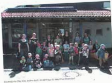
Begleitende Öko-Kids, Kath. Kinderhaus St. Mauritius Kissendorf