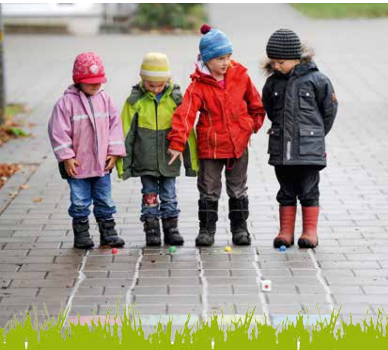
Auch an den Erlebnistagen des LBV-Kindergartens finden sich vielfältige Spielmöglichkeiten im Freien.